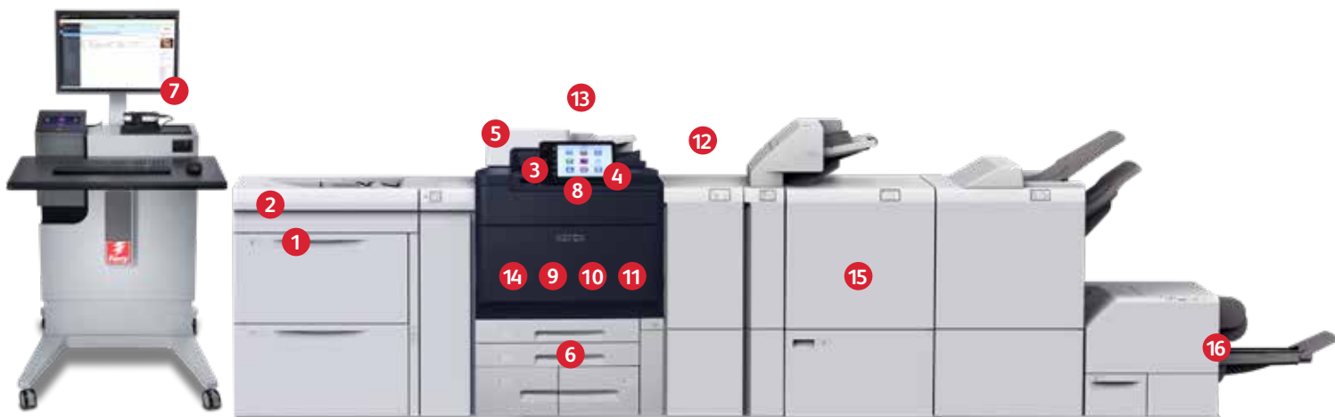
Abgebildet: Fiery EX Print Server, Großraumbehälter für Überformate mit zwei Behältern, Drucker der Xerox® PrimeLink® C9200 Serie, Zwei-Seiten-Trimmer mit Rillfunktion, Xerox® Production Ready Broschürenmodul-Finisher, Xerox® SquareFold® Trimmer®